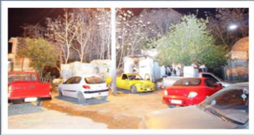
Η Πλατεία Φανερωμένης πριν την Ανάπλαση