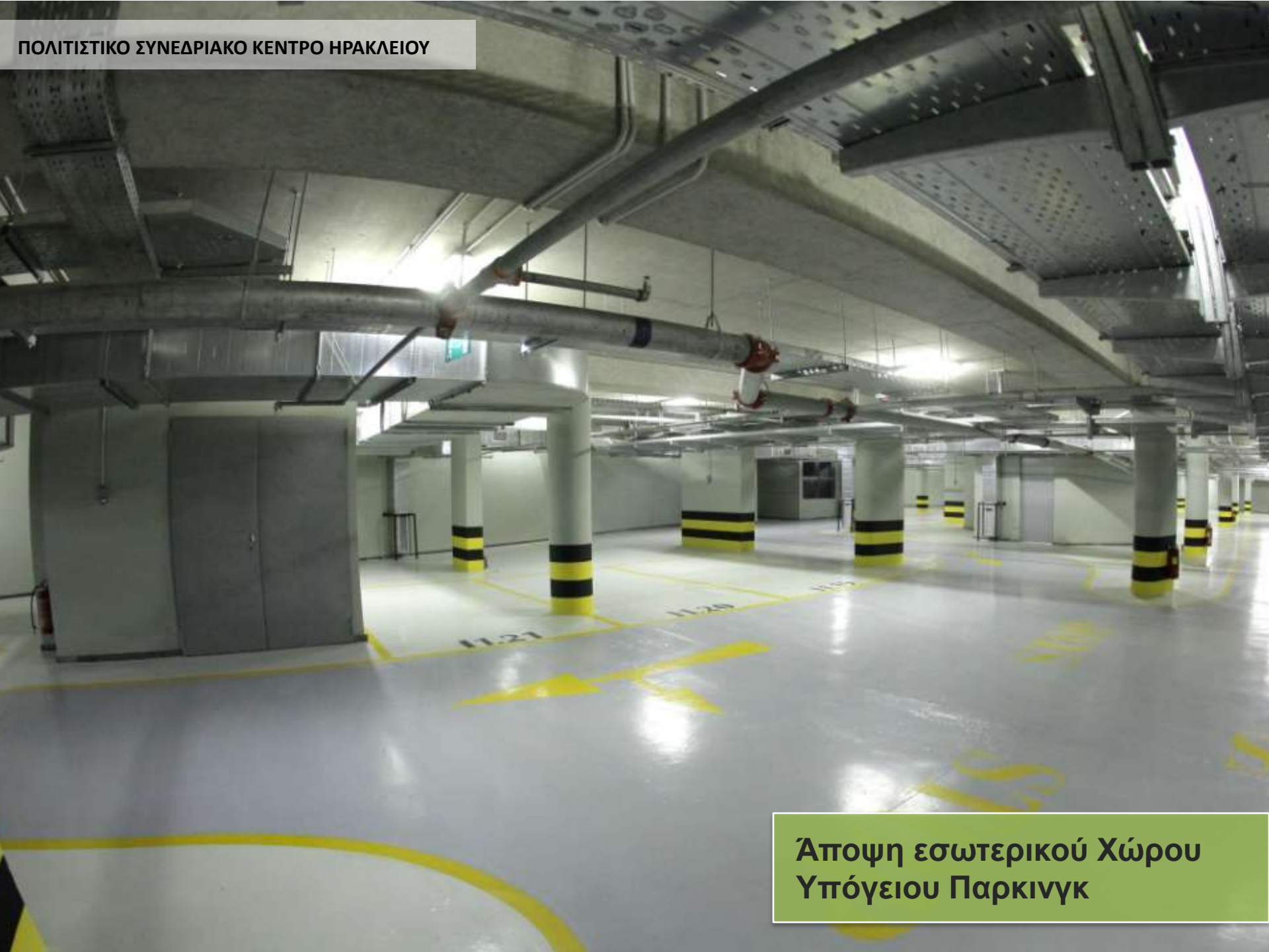
Άποψη εσωτερικού Χώρου Υπόγειου Παρκινγκ